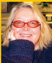
Kine Aune (Norway) Film and Theatre Director/ Producer