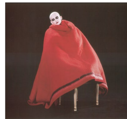
"Harpya" (1979) directed by Raoul Servais

Bulletin No.2 will announce.. International Jury, Program Schedule, Ticket Information