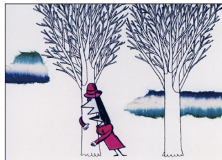
"LOVE" (1963) directed by Yoji Kuri

世界で唯一、学校・学生・企業を結ぶユニークなマーケットです。国内の主要なアニメーション教育機関にブース出展していただき、アニメーション制作を志す学生には自分の才能を発表し国際的飛躍を目指す場として、教育機関には学校のPR・学生確保の場として、プロダクションや企業の皆様には若い優れた才能発掘の場として活用していただけます。世界の学生作品の視聴コーナーもあります。アニメーション教育機関の出展及び皆様のご参加をお待ちしております。