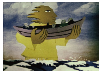
"Big Tylil" (1980) directed by Rein Raamat, in "Estonian Animation Special Program"